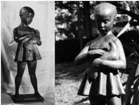
La niña y la paloma