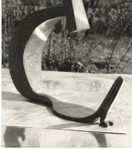
Escultura de madera