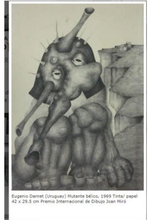
Eugenio Darnet (Uruguay) Mutante bélico, 1969 Tinta/ papel 42 x 29.5 cm Premio Internacional de Dibujo Joan Miró